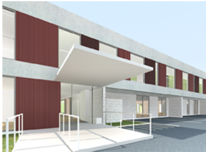
北側外観イメージ