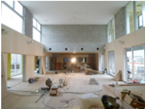
吹抜けのあるデイサービス

回答先 : FAX : 092-741-9352 E-mail : fukuoka@aokou.jp