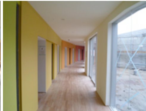
壁面に彩色を施した南側廊下