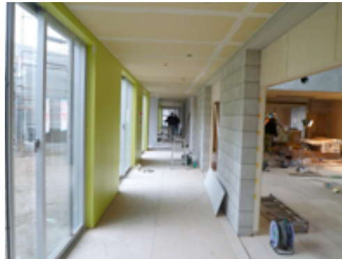
CB素地仕上げの北側廊下